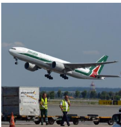
Un aereo Alitalia durante il decollo

tendo però le mani avanti sul fatto che «non è escluso che ci sia un intervento pubblico anche in questa fase della procedura», perché «non possiamo buttare quello che è stato fatto». E ricorda che «Alitalia perde ogni mese quasi 2 milioni di euro», per cui «il nuovo commissario unico avrà il compito di proporre modifiche al piano di cessazione e limitare la parte costi». Nella vicenda interviene il leader della Lega Matteo Salvini che con una nota afferma: «Anche sul futuro di Alitalia, come in troppi altri casi, confusione totale dalle parti del governo», innescando così la polemica con il ministro M5s. «Noi abbiamo le idee ben chiare - ribatte Patuanelli e attacca - Stiamo cercando di risolvere la confusione fatta da altri». E insiste: «Vogliamo ricordare cosa è stato fatto nel passato, con i capitani coraggiosi?». Guardando avanti e alle possibili soluzioni per rilanciare Alitalia, il ministro spiega che «Delta rimane un interlocutore potenziale, così come la proposta commerciale di Lufthansa al consorzio» e che sarebbe «possibile e necessario un ulteriore coinvolgimento di Ferrovie» nella nuova, anche se la decisione comunque «spetta al com-